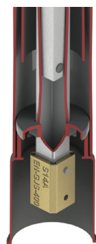
JMA, GF, ZOIGO, BELGICAST